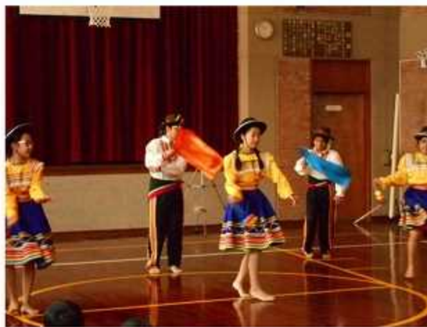
ラ・ウニオン校が踊りの披露