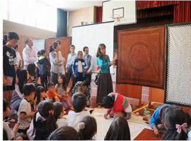
馬場様による泥染めの説明