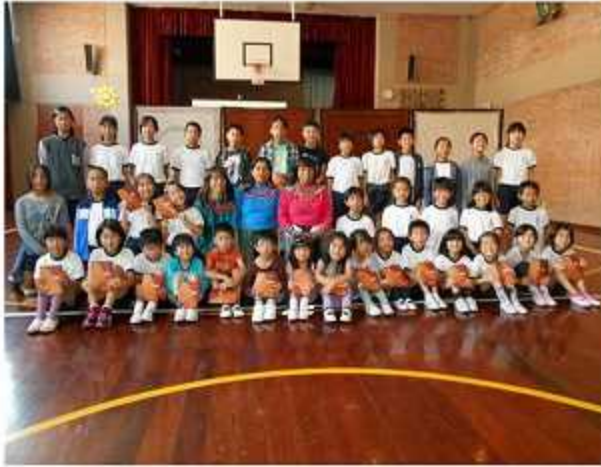
馬場様・シピボ族の方と一緒に