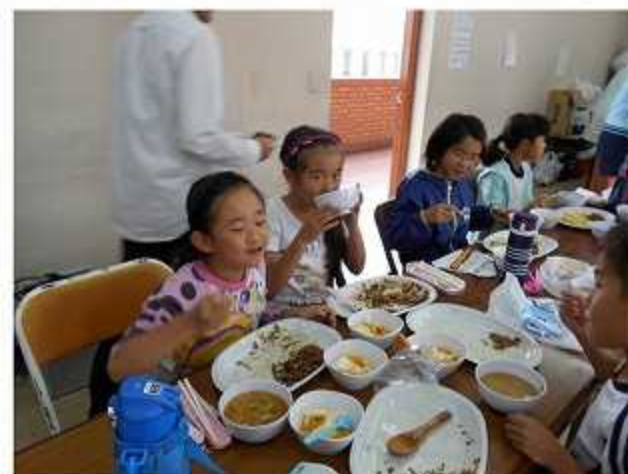
おいしくてたまりません