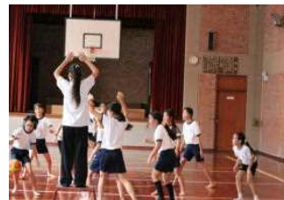
体育館ではポートボールも