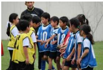
試合開始のあいさつ

第3回目となりました「わくわくタイム」。今回は日系校のビクトリア校とのスポーツ交流です。いくつかのグループに分かれてのサッカーの試合はとても盛り上がりました。保護者のチームも結成されました。中庭では竹馬や羽根つき、体育館では、卓球やポートボール等が行われ、親睦を深めることができました。