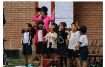
応援も頑張ってます

<今後の行事予定> (一部再掲) 【8月】19(水)2学期始業式、22(土)わくわくタイム、25(火)エル・ボスケ全校宿泊学習関係合同学活、30(土)サンタロサ 【9月】1(火)授業参観、非常事態訓練、2(水)授業変更(月曜日の授業)、4(金)ラ・ウニオン校訪問、7(月)~11(金)発育測定週間、11(金)バス指導、14(月)委員会(前期最終)、17(木)~18(金)エルボスケ宿泊学習、24(木)マラソン練習開始、26(土)リマ日祭、28(月)委員会(後期初回) 以下次号