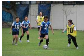
白熱した試合でした