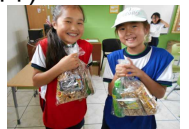
勢いお菓子がたくさん