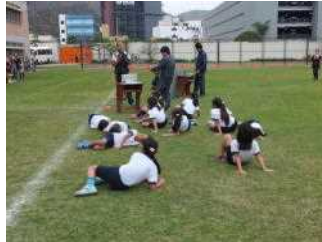
走り終わった3・4年生