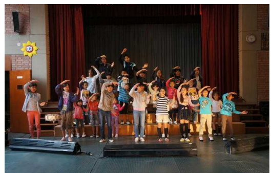
開会式でのスローガン発表