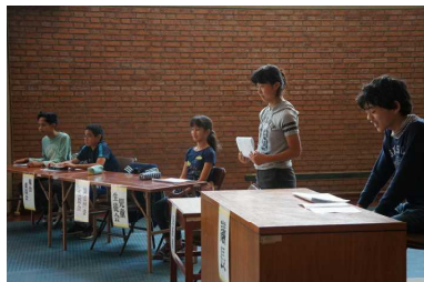
新役員による議事進行

後期の児童生徒総会(10月13日) 小学1年生から中学2年生まで、全校児童生徒での生徒総会です。新役員での後期の委員、会のスタッフが活動したいアイデアはありますか?」等活発に質問、発表する姿は学校をしっかりと支えくれる頼もしさを感じました。