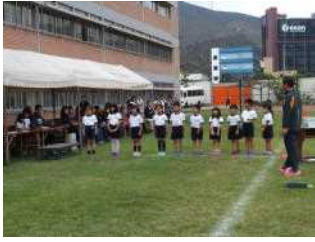
1年生はドキドキです

10月7日(水)にマラソン大会が実施されました。当初の予定から日程が変更されたにも関わらず、たくさんの保護者のみなさんの声援を浴び、子どもたちは全員が全力で走り抜くことができました。9時半から体育の授業、リマ日タイムで校庭を走り、走力を向上させました。距離は、小学部1、2年が600m、3、4年800m、小5、6年女子1200m、小5、6年男子および中学部女子1600m、中学部男子2400mでした。中学部男子の部に校長先生も飛び入り参加。大会の後はPTAの皆様よりいただいたジュースとクッキーをおいしくいただきました。