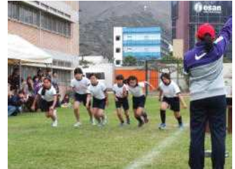
5・6年生女子のスタート