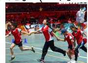
他の学校と一緒に