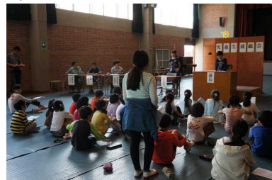
活発な意見が出されました

ラユニオン校の運動会に参加しました。4、5、6年の6名が参加した日系校のラユニオン校運動会。明治、大正、昭和、平成の4団(4色)に分かれての競技や応援合戦は圧巻でした。(10月18日)