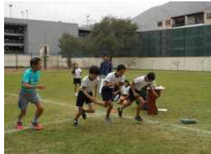
中学部男子、校長先生も一緒に