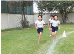
中学部女子の力走