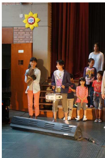
楽器でのタイミング合わせ