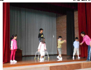
演技指導は続きます