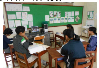
パソコンで演技のチェック