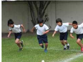
5・6年生男子のスタート