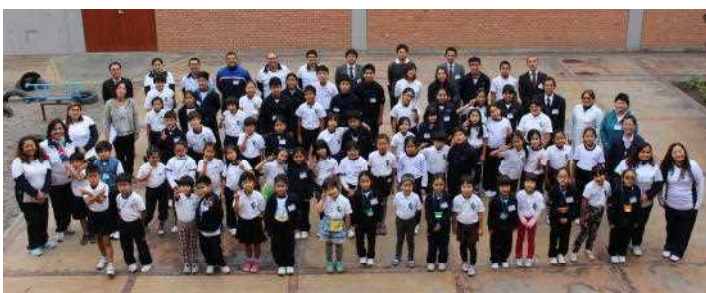
全員での記念写真