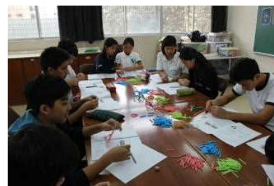
中学部数学の授業