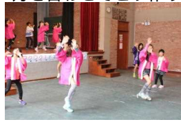
タレントショー（ダンス、マリネーラ）