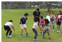
レクリエーション