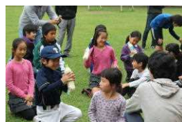
氷鬼でピザ生地作り

9月24日（土）PTAリマ日祭2016が行われ、第一部はピザ作り、第二部はわたあめ作り、第三部は不思議な液体作り、第四部はステンシル作り、第五部は人形すくい、第六部はタレントショー、第七部はバザー、第八部は抽選会が行われました。保護者の皆様、長期間の準備、運営大変ありがとうございました。とても楽しい一日となりました。