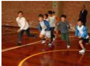
不審者から逃げる