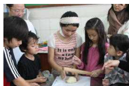
力を合わせてピザ作り