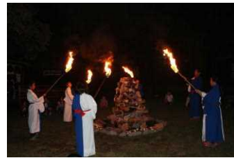
キャンプファイヤー