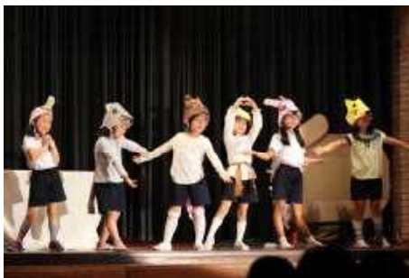
小1 初めての舞台発表も 元気いっぱい