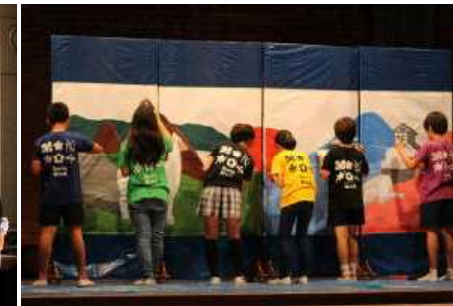
小5・6 ペルーと日本の架け橋