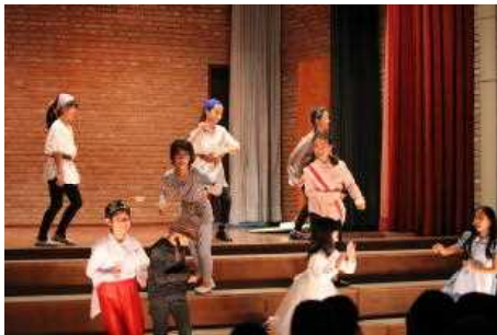
小4 ミュージカル調ですごい