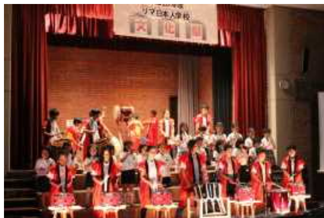
文化祭の全校合奏

どうぞこれからも気軽にご意見をいただき、よりよい学校作りに力をお貸しいただければ幸いです。