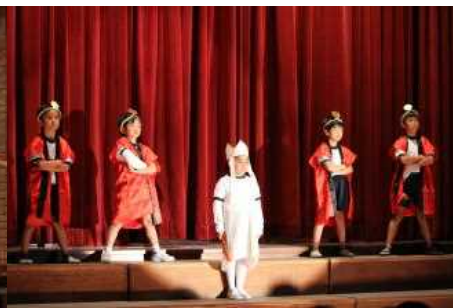
小2 早口ことば、すごい