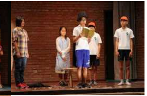
中学部 考えさせられる内容でした