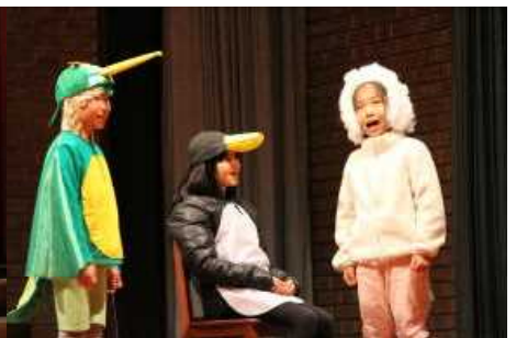
小3 どうしたもんじゃろう?