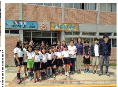
エンマヌエル協会の方と一緒に