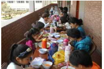
オープンテラスで食欲倍増