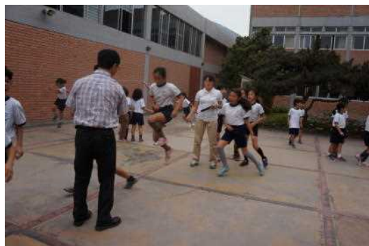
リマ日タイム 長縄跳び