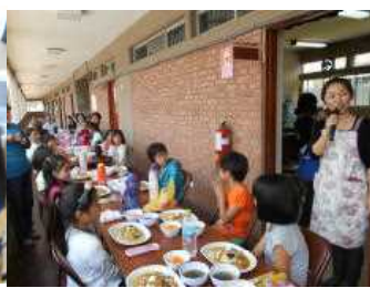
担当の方からの一言