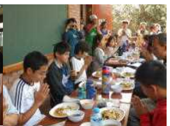
感謝を込めて「いただきます」