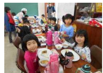
初めての給食デー

準備から調理まで心を込めて作ってくださったお父さん、お母さん、本当にありがとうございました。