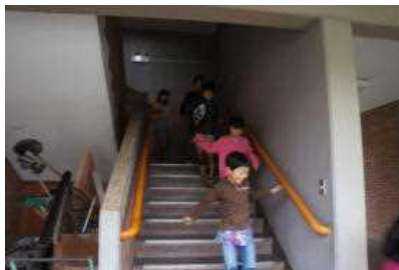
階段を駆け下りる3年生

7月12日(水)に第4回目の非常事態訓練を実施しました。今回は、テロリストが正門から侵入したという想定でした。避難音を聞いた児童生徒は一齐に走ります。もちろん無言です。命にかかるとすから真剣です。避難した場所はマル秘ですが、避難場所として受け入れていただいている方には感謝です。起きては欲しくない非常事態ですが、訓練は必要不可欠です。大使館の方から今回の訓練についてのアドバイスもいただきました。ありがとうございました。