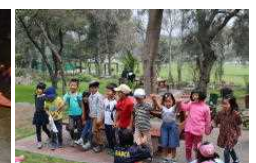
退所式で1年生感想