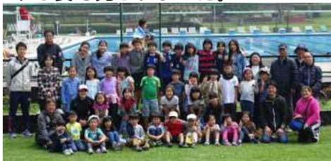
プールの前で全体写真 行きも帰りも大使館から依頼していただいた警察の方々に警護をしてもらいました。

9月14日(木)～15日(金)にエル・ボスケ宿泊学習を実施しました。児童生徒にとっては年間で一番楽しみにしている行事かもしれません。小中全体での縦割り班により活動を行います。レクリエーションは4年生、キャンプファイヤーは5,6年生、ウォークラリーは中学部が担当します。野外炊飯、乗馬、ボート、テニス、卓球、バスケット等を通して、小学1年から中学2年までの全員がよく協力しながら学びました。退所式では、小学部1年生が楽しかったことの発表をしました。今年のエルボスケ宿泊学習では、上級生が下級生の面倒を見る姿が多く見られました。心配していたカレー作りも、どの班も時間通りに出来上がりました。後片付けも食事班を中心に自分の仕事を責任を持ってやり遂げようとする姿も見られました。