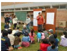
スポーツレクスタート

9月23日(土)に「元気いっぱい 走ろう遊ぼう リマ日祭」のテーマのもと、PTAリマ日祭2017が行われました。第1部はスポーツ大会と、ミニタレントショーです。第2部は軽食、ゲーム屋台です。輪投げ、ストラックアウト、わたあめ、そして職員によるスライム作り等、どれも大盛況でした。第3部はバザーと抽選会が実施されました。ご協力をいただいた各企業の皆様ありがとうございました。保護者の皆様、長期間のご準備、運営大変ありがとうございました。とても楽しい一日となりました。