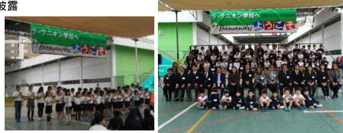
全校パフォーマンスと全体写真

9月1日(金)にラ・ウニオン校訪問交流学习が行われました。6月には本校に来ていただきましたが、その時の友達との再会をお互いが喜んでいました。ラ・ウニオン校の1000名を越える児童、生徒、教職員の歓迎を受け、各クラスで授業を受けました。児童生徒はスペイン語を使い、手振りを混ぜながら、積極的に交流をしました。お別れセレモニーでは「ふるさと」の合唱と「クラッピング・ファンタジー」の合奏を披露しました。