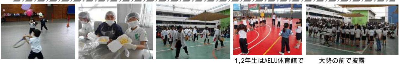
全体レク 全員でカウサ作り 5,6年はエイサー披露 1,2年生はAELU体育館で 大勢の前で披露

アレハンドラ先生クラス 市木先生クラス カルメン先生クラス 9月5日(火)の5時間目はスペイン語の授業参観でした。その後、本年度5回目の非常事態訓練を実施しました。今回は地震に対する避難訓練です。保護者の皆さんも一緒に、迅速にそして真剣に避難することができました。