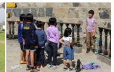
中学部運営のウォークラリー