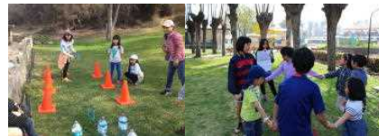
中学部運営のウォークラリー