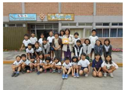
エンマヌエル協会の方と一緒に