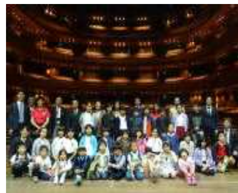
観客席をバックに!!

グラン・テアトロ・ナショナルという国立劇場の見学へ行きました。コンサートホールがどのように作られているのかや、音楽をよりよく聴くためにどんな工夫がされているのかをガイドさんの説明を聞きながら学びました。事前に準備をしていた質問にもガイドさんは的確に答えてくれ、充実した時間を過ごすことができました。ステージの上で合唱も体験させてもらいました。