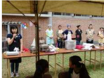
担当の方からの一言