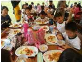
運動場の真ん中で