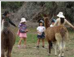
リヤマもいました