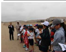
さあ太陽の神殿に出発

12月2日(土)にパチャカマック遺跡の見学に行きました。昨年、博物館が新設され見所が増えました。低学年と高学年の二つのグループに分かれて担当の方に丁寧な説明をもらいながら、ペルーの歴史についても学ぶことができました。学校からそれほど遠くない場所にこのような遺跡が残っていることに驚きを感じています。