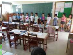
4月に会いましょう

<ご紹介> 海外子女教育振興財団から毎月送っていただいている「海外子女教育」の海外校シリーズに本校の様子が掲載されました。内容は以下の通り ・現地の教育環境 ・子どもたちが引き継ぐ五十年の伝統 ・日本とのかかわりの深いペルー・リマ