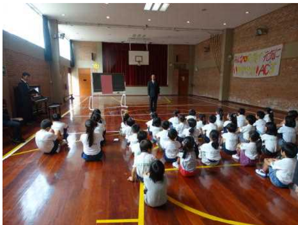
3学期始業式の様子

さて、私自身も昨年を振り返り、今年の努力目標を考えてみました。それは「挨拶をする・時間を守る・後始末をする」の徹底を図るということです。これは赴任当