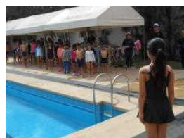
中学部による模範泳法

1月9日(火)いよいよプール(水泳)がスタートしました。プール開きでは、中学部の生徒による模範水泳、そして、自由遊びを行いました。2月17日(土)は水泳記録会です。体育の授業や、放課後の補習、そして、プール開放日を利用して、自分の目標に向かって頑張りたいと思います。