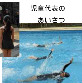
児童代表のあいさつ