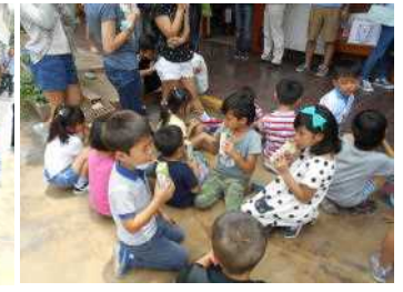
PTAからジュースをいただきました。