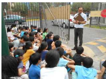
二次避難所に無事到着