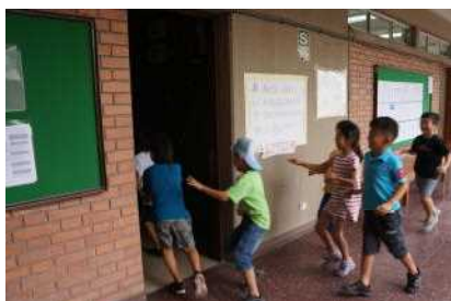
校内のシェルターに避難

1月10日(水)第7回非常事態訓練を実施しました。今回はテロリスト侵入を想定して学校敷地外への避難です。最初に校内の避難場所へ。次に校門から外へ避難し、全員が無事かを確認し、さらに遠くへと避難する訓練です。二次避難はより安全な場所へのもので、3年ぶりに実施しました。決して起こっては欲しくないものですが、自分の命は自分で守ることが第1です。訓練は何度してもしすぎることはありません。常にいざという時のことを想定して毎日を送らなければいけないことを再認識しました。