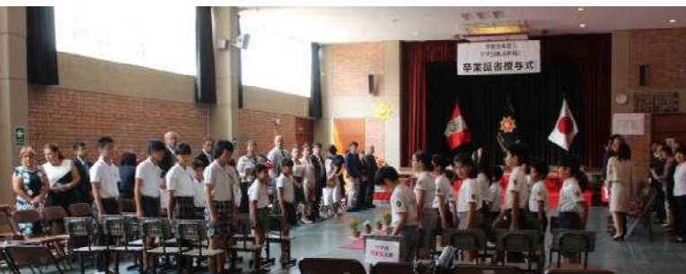
卒業証書授与式 会場