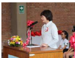
日本国大使館 参事官 梶本泰代様